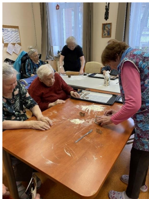
Medové perníčky nesmí chybět na vánočním stole - 30. 11. 2022