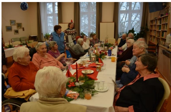
Vánoční posezení DPS A - 21. 12. 2022