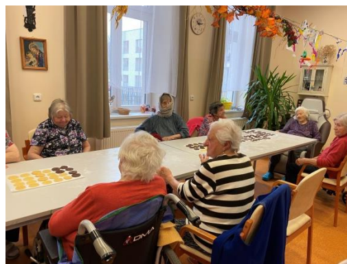
Pečení sušenek - 23. 11. 2022