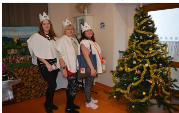
Tři králové - 6. 1. 2023