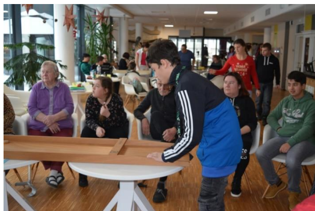
Vánoční posezení s dětmi ze Základní školy a Praktické školy U Trojice – 19. 12. 2022