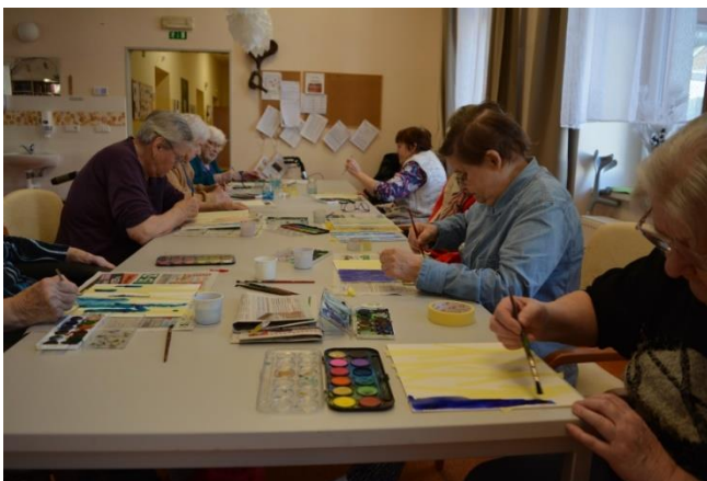
Výtvarná dílnička - 7. 12. 2022