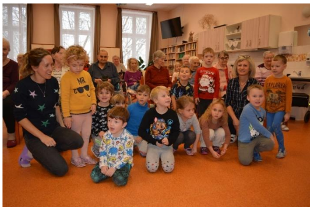
Adventní vystoupení dětí z MŠ na DPS A - 12. 12. 2022