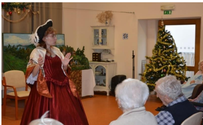
Beseda o princeznách 18. století - 30. 11. 2022