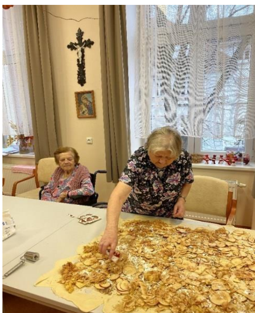
Pečení tradičního štrúdlu - 9. 11. 2022

„Jak šel čas“ jsme zaznamenali v naší fotogalerii.