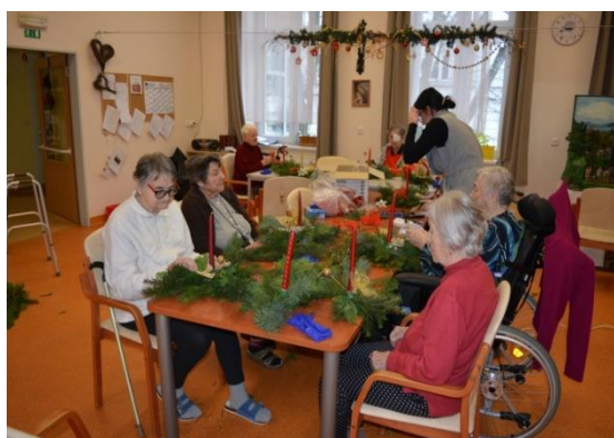
Výroba vánočních svícňů z přírodních materiálů – 21. 12. 2022