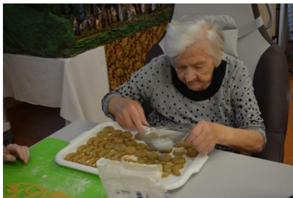
Sladké pečení cukroví - 12. 12. 2022