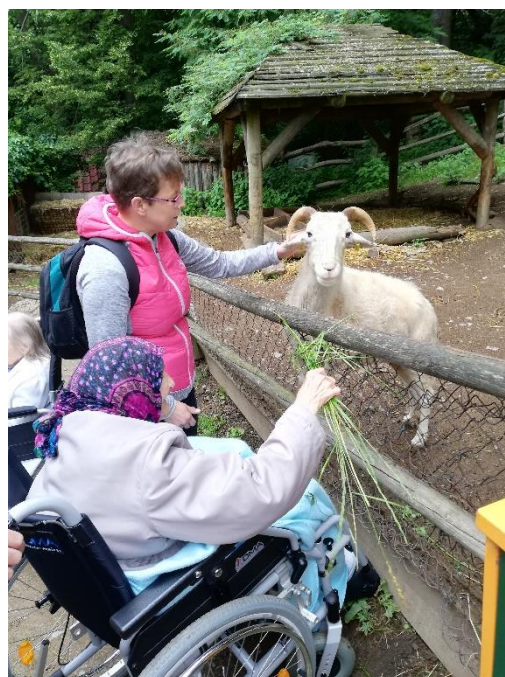
Komentované krmení a naše krmení ovcí