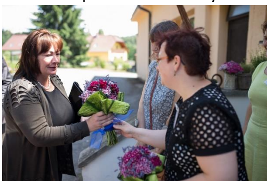
Uvítání vzácného hosta.