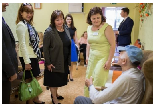
Paní Zemanová pozdravila naše obyvatele...