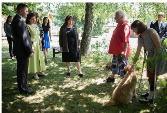
Pes Leon vzbudil živý zájem všech.