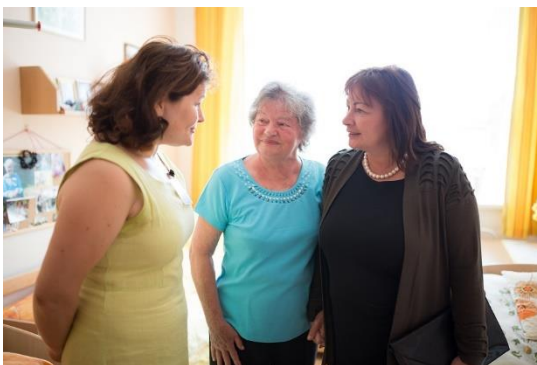
... a navštívila je na pokoji .