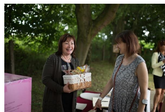
Vzájemně předané dárky všechny potěšily.