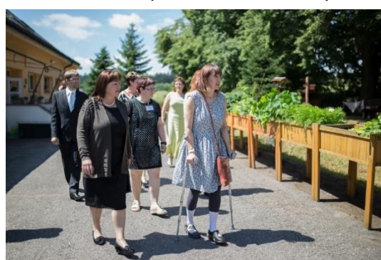
Prohlídka naší úrodné zahrádky.