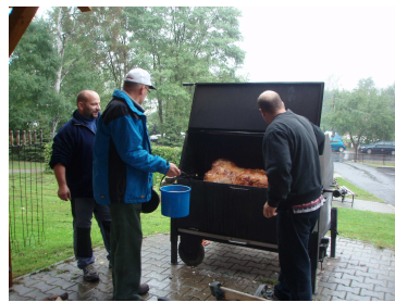
Zahradní slavnost - opékání prasete