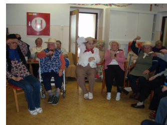
Vystoupení senierek při masosopustu

Podporujeme obyvatele ve využívání návazných služeb ve městě, zajišťujeme návštěvy banky, úřadů, odvoz na nákupy ve městě apod. Za pomoci dobrovolníků zajišťujeme návštěvy knihovny a jiných kulturních zařízení.