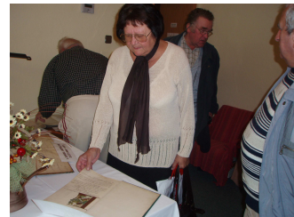
Návštěvníci při prohlídce

V roce 2008 jsme splnili závazné ukazatele finančního vztahu k rozpočtu zřizovatele a úspěšně prošli auditem hospodaření za rok 2007.