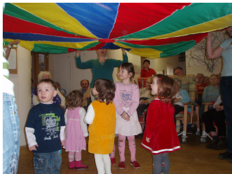
Vystoupení mateřského centra Zvoneček

Sociální úsek poskytuje pomoc při řešení problémových situací obyvatel, pomoc se žádostmi o sociální dávky, při vyjednávání s úřady apod. Sociální pracovníce jsou s obyvatelem v kontaktu již před jeho nástupem i během pobytu v domově.