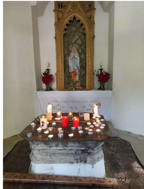
Výlet ke sv. Anně