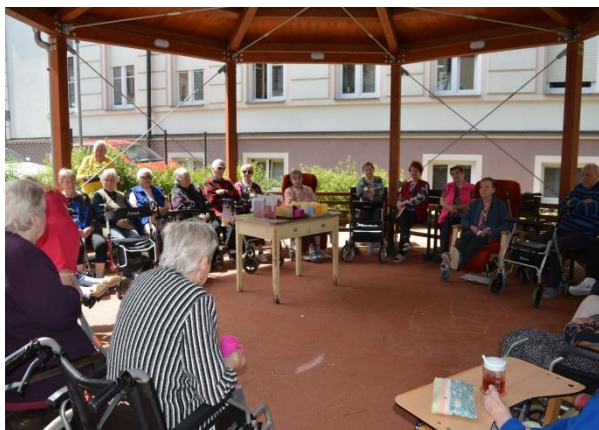
Posezení v zahradě a opékání špekáčků