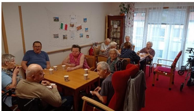
Naše narozeninová posezení

Využili jsme krásný slunečný zářivý den a připravili jsme našim klientům zahradní zmrzlinovou párty, účast byla téměř stoprocentní.