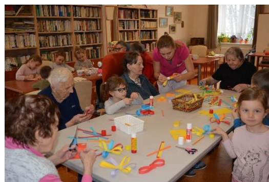
Výtvarné dílničky s dětmi z MŠ