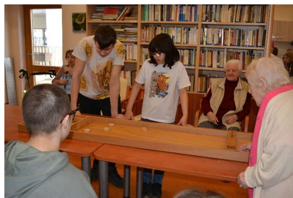
Společný turnaj v Šoupané