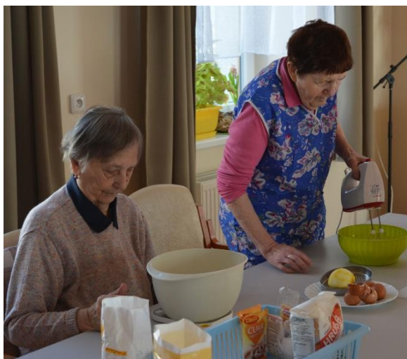
Pečení na Velikonoce