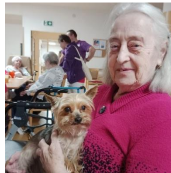
Každý týden se těšíme na naše malé psí kamarády

Masopust se vydařil, všichni si moc pochutnali na smažených koblížkách, pozorně si prohlédli masky a zatančili si při muzice.