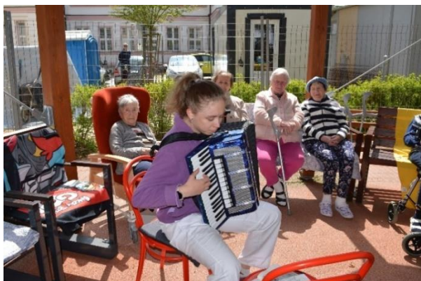
Vítání jara spojené s opékáním buřtíků 3.5.2023