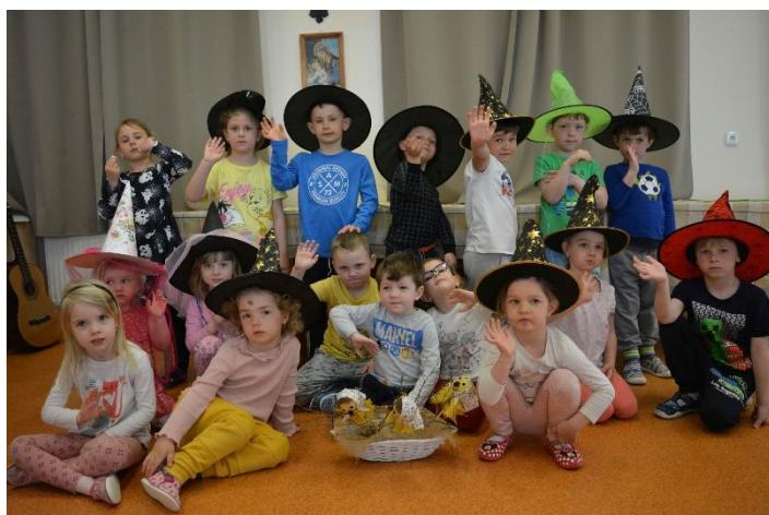
Děti z naší MŠ Husova