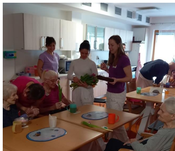
Začátkem března jsme oslavili MDŽ