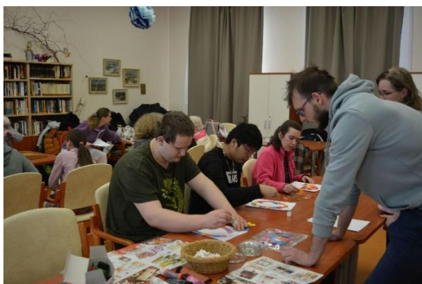
Návštěva dětí od Svaté Trojice